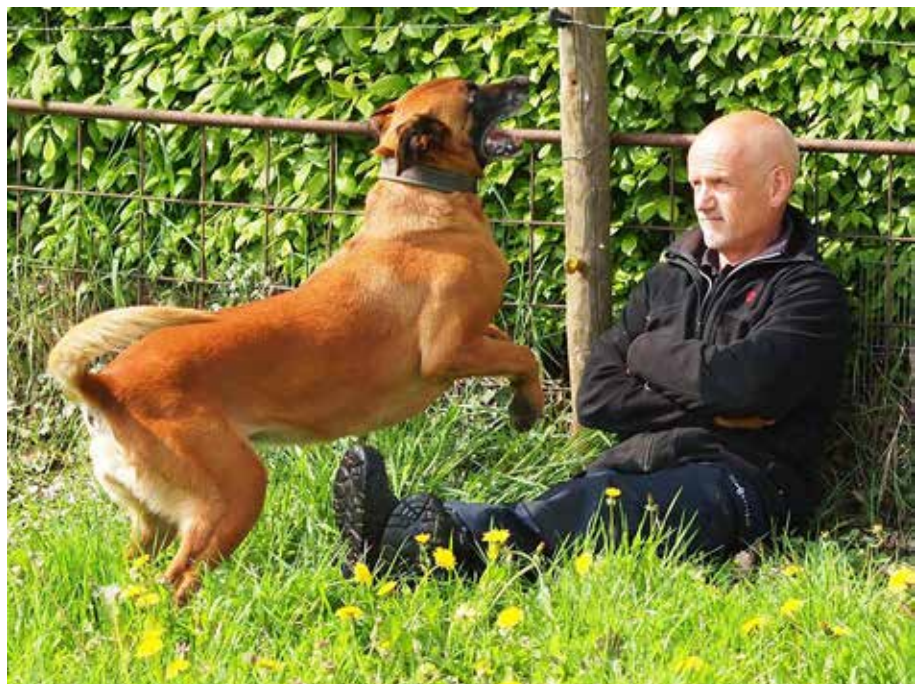
Als voorbereiding op het man revieren is het blaffen op de burger een mooie 1e stap

Als de hond zo ver gevorderd is, dat hij door middel van intervaltraining heeft geleerd langdurig op de kist te blaffen, ga ik pas verder. Intervaltraining wil zeggen, dat je de hond voortdurend gevarieerd moet belonen. De ene keer voor 1 blaf en dan weer voor 10 keer blaffen en dan weer voor 2 keer enz. Je zult merken dat de hond dit als heel prettig en spannend ervaart, waardoor hij zelden of nooit tot bijten over zal gaan.